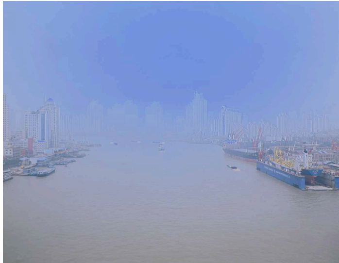
Nan pu , 2006. Ilfochrome transparency, lightbox 102 x 130 cms

La exposición se completa con cuatro grandes fotografías para cajas de luz, pertenecientes al proyecto Lock en la presa de las tres gargantas. En ellas Catherine recurre a la yuxtaposición de un positivo con un negativo obtenidos con intervalos de segundos de la imagen. De esta forma la artista introduce la duración en la toma fija y el efecto de desestabilización que a su vez producen esos colores azul y verde ácido tan característicos de sus cajas de luz. En estas piezas, “la desestabilización queda asimismo de manifiesto en el trabajo fotográfico que se muestra en cajas de luz. Las imágenes están tomadas desde el centro de puentes que dominan el fluir del Yang tsé en Shanghai y Chongqing. Tomadas con una cámara de gran formato sobre placa sensible, están compuestas por dos exposiciones, un positivo, y un negativo que se ha procesado para modificar los colores. Como las barcas se desplazan, hay un movimiento entre exposiciones que siempre escapa a la cámara, y a las embarcaciones parecen seguirlas sus propias sombras o memorias. La bruma o contaminación de las ciudades parece disolver las orillas y los edificios que estas transponen. La luz interna de las cajas de luz se suma a la sensación de fantasmal desaparición y aparición”, matiza la artista.