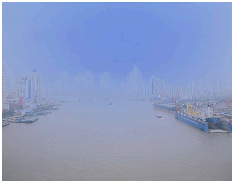
Nan pu , 2006. Ilfochrome transparency, lightbox 102 x 130 cms

Yass' conception of the cinematographic process utilizes both the tradition of experimental cinema and contemporary video installation. From the former the artist takes the absence of plot and characters to recreate one of the classic genres of the visual arts: the landscape. From the latter she employs the space of the museum in order to touch on the physical interaction of the film with the viewer.