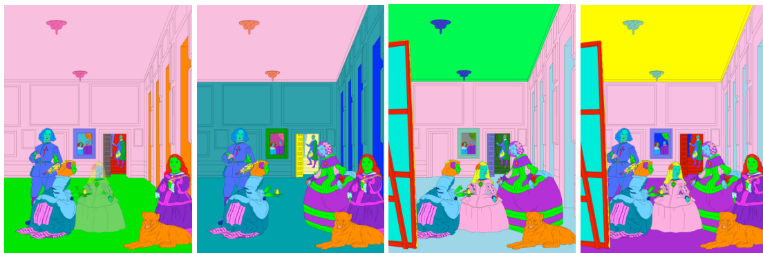
Michael Craig-Martin: Deconstructing Velázquez , 2008. Video para pantalla de cristal líquido en edición de 10 ejemplares

Su obra ha sido objeto de exposiciones retrospectivas en el Irish Museum of Modern Art en 2006, en el Kunst Haus Bregenz de Austria en 2006 y en el National Art Centre de Tokio en 2007. En Londres tiene dos grandes instalaciones permanentes en Regent's Place y en el Laban Center. En 2006 fue elegido miembro de la Real Academia británica y su trabajo se encuentra representado en numerosas colecciones como Tate Gallery de Londres, Nacional Gallery de Australia en Canberra y MOMA de Nueva York.