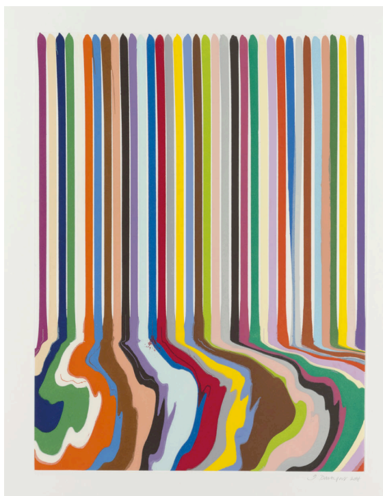
Ian Davenport: Etched Lines , aguatinta de 2009

Ian Davenport (Kent, 1966), se graduó en el Goldsmiths Collage of Art en 1988 y como miembro de la generación de Young British Artists, participó en 1988 en la exposición Freeze. En 1991 fue seleccionado para Premio Turner y desde entonces ha mostrado su trabajo por todo el mundo, recibiendo distintos encargos específicos de murales de gran formato entre los que destaca un mural de 50 metros bajo el puente de Southbank en Londres. En 1999 recibe el primer premio John Moores.