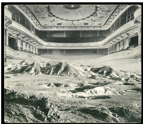
Desierto , fotografía de 2009 sobre papel de 156 x 135 cm.

En la serie Extravíos (1995-99), esta fusión de técnicas de reproducción genera texturas mixtas e inciertas, propuestas al espectador como huellas confusas del tiempo. El artista formula una iconografía de la vieja felicidad, formada en gran medida por los rostros del cine norteamericano de los años 30 y 40. En Sucedáneos (1999-2003) las imágenes de tartas, joyas o manos de mujer se muestran como objetos de deseo y tentación que ostentan al mismo tiempo la imposibilidad de ser poseídos. Las imágenes de Viaje interior (2004-2008) presentan formas de vida creadas digitalmente, entes insólitos con ecos de ciencia-ficción y que interfieren en paisajes del pasado, generando un diálogo entre tiempos.