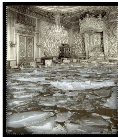
Of ice photograph from 2009, 65 x 57 cm.

In Precipitados (Precipitates) (2008-2009), the series that we now present, emblematic spaces of our culture come into contact with natural elements (water, ice, sand). The reflection on the perennial nature of memories at the same time provides a new reading on the documentary role of the photographic image. Culture conquered by nature, or nature imprisoned by culture? Precipitados proposes a farewell journey to all that which was once an emblem of our achievements. The physical destruction of these spaces is none other than the materialisation of an earlier destruction – current and ours – whose signs are as teasing and ambiguous as the veracity of an old print. In these images from Pablo Genovés, the struggle between the two has been eternal, and it is no longer possible to discern who is attacking whom. The fight for the appropriation of space leads to scenes of destruction, of the end of an epoch, with a nod in the direction of the catastrophist forebodings which today, more than ever, sharpen the collective imagery. These images in turn come from pre-existing realities: old prints which the artist rescues and transfigures, releasing the photographic image from its eternal validity, endowing the elements of the past with a new capacity for evocation.